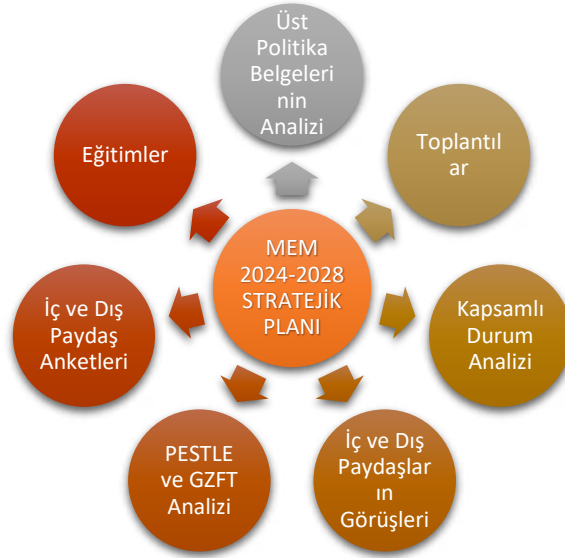
Şekil 1. Stratejik Plan Hazırlık Aşamaları

Stratejik plan hazırlık çalışmalarının başladığı kurumumuzda Genelge kapsamında Stratejik Planlama Ekibi oluşturulmuş ve planın sahiplenilmesi sağlanmıştır. Hazırlık döneminde planın tüm birimlerce sahiplenilmesi, planlama sürecinin organizasyonu, ihtiyaçların tespiti, zaman planlaması gibi unsurlar ve durum analizinin yöntemleri ile geleceğe bakış kısmını oluşturan misyon, vizyon ve temel değerler kavramları gibi ana hatlar yer almaktadır. Vakıfkebir Hikmet Kaan İmam Hatip Ortaokulu Müdürlüğümüz 2024–2028 Stratejik Planı; literatür taraması, toplantılar, kapsamlı durum analizi raporu (üst politika belgelerinin analizi, mevzuat analizi, faaliyet alanları ile ürün ve hizmetlerin belirlenmesi, PESTLE ve GZFT analizleri, uygulanmakta olan stratejik planın değerlendirilmesi, iç ve dış paydaşların görüşlerinin alınması, kuruluş içi analiz ile tespit ve ihtiyaçların belirlenmesi) doğrultusunda hazırlanmıştır.