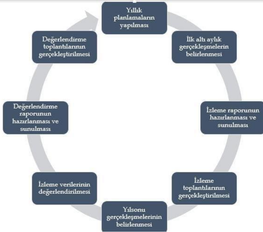
Şekil 3 İzleme ve Değerlendirme Süreci

İzleme ve değerlendirme sürecinin işleyişi ana hatları ile aşağıdaki şekilde özetlenmiştir.